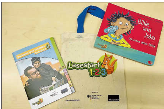
Lesestart Set 3, kostenlos in der Mediathek

Ab sofort können Eltern mit ihren Kindern ab 3 Jahren die neuen Lesestart-3-Sets in der Mediathek kostenlos abholen kommen. Sie erhalten eine schöne Stofftasche mit dem Pappbilderbuch „Billie und Joko brauchen deine Hilfe“ von Barbara van den Speulhof mit Illustrationen von Julia Weinmann. Dazu gibt es eine mehrsprachige Informationsbroschüre für die Eltern, um ihnen die Bedeutung des Vorlesens und Tipps zum gemeinsamen Entdecken von Geschichten zu vermitteln.