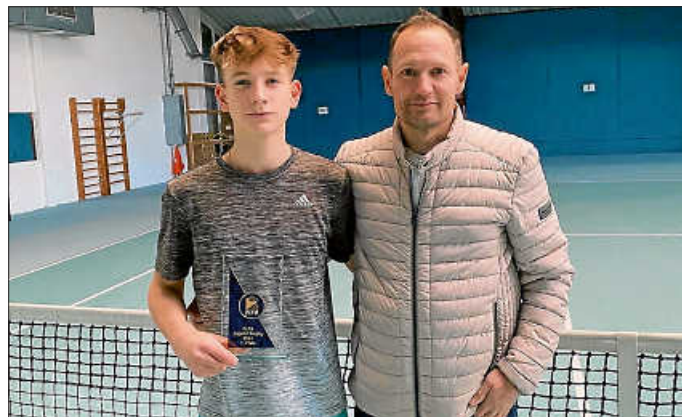
Vincent mit dem Pokal und seinem Vater