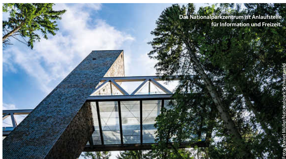
Das Nationalparkzentrum ist Anlaufstelle für Information und Freizeit.

Alles in allem ein echter Grund zum Feiern! „Über das gesamte Jahr wollen wir Bürgerinnen und Bürger bei Führungen und Veranstaltungen dazu einladen, den Nationalpark vor Ort und gemeinsam mit uns zu erleben. Wir wollen genau hinschauen, auf die großen und kleinen, die sichtbaren und verborgenen Veränderungen“, sagt Schlund voll Vorfreude auf ein volles Programm zum Jubiläumsjahr. (pm/red)