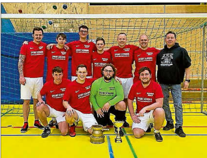
Das erfolgreiche Urbacher Team

Die Mannschaft aus Urbach startete im ersten Spiel mit einem 1:1 gegen die Feuerwehr Alfdorf Abteilung Pfahlbronn in das Turnier. Das zweite Spiel konnte dann gegen die Feuerwehr Schwäbisch Hall klar mit 9:0 gewonnen werden. Es folgten weitere Siege gegen Wäschenbeuren, Plüderhausen und Durlangen. Somit zog man als Gruppensieger der Gruppe A verdient ins Halbfinale ein. Hier traf man auf die Feuerwehr Alfdorf Abteilung Vordersteinenberg und konnte durch einen 4:0-Sieg ins Finale einziehen. Im Finale konnte sich die Feuerwehr Urbach gegen die Mannschaft aus Schwäbisch Gmünd dann den verdienten Turniersieg sichern.