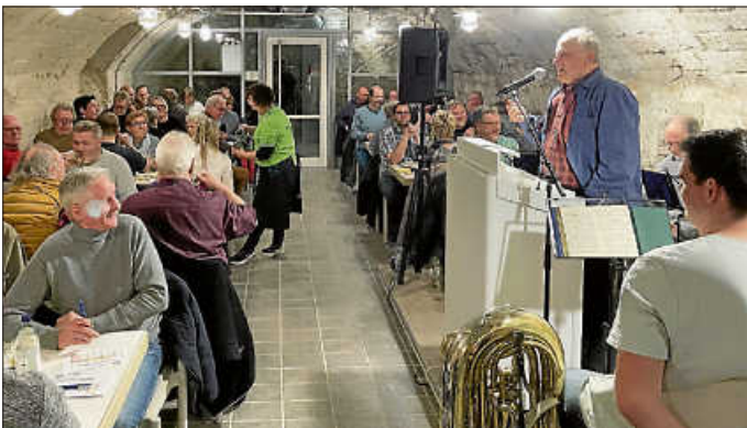
Stilvoll, urig und original - das ist das Urbacher Mostseminar

„Zviel vom Moscht han i scho oft ghet, aber no nia gnuag.“