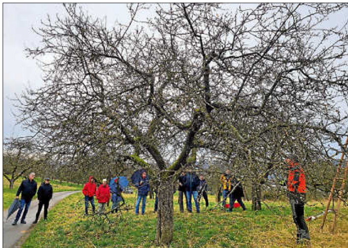
Apfelbaum vor dem Schnitt

Ausreichende Belichtung und Belüftung wird durch einen Schnitt ebenfalls erreicht. Nach einem Regen kann bei genügender Belüftung der Baum wieder rasch abtrocknen und somit wird der Ausbreitung von Pilzen wie Schorf Einhalt geboten.