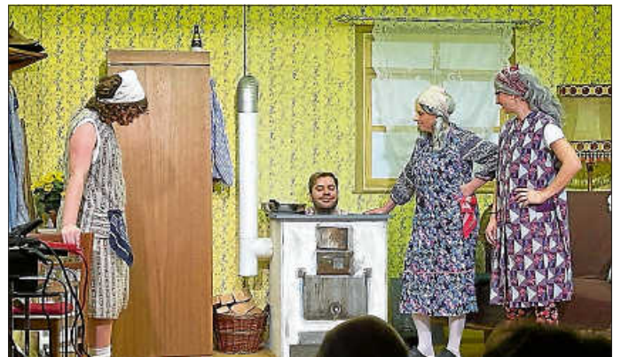
Ein lustiger, schwäbischer Nachmittag

„Wo ist denn nur der Ernst geblieben“, so hieß die Komödie, die aufgeführt wurde. Wir haben die Aufführung in vollen Zügen genossen und es wurde viel gelacht und geschmunzelt. Das Theaterstückle war, wie wir es von Walkersbach gewohnt sind, ein voller Erfolg. In breitem, derbem und lustigem Schwäbisch haben wir den Nachmittag in vollen Zügen genossen.