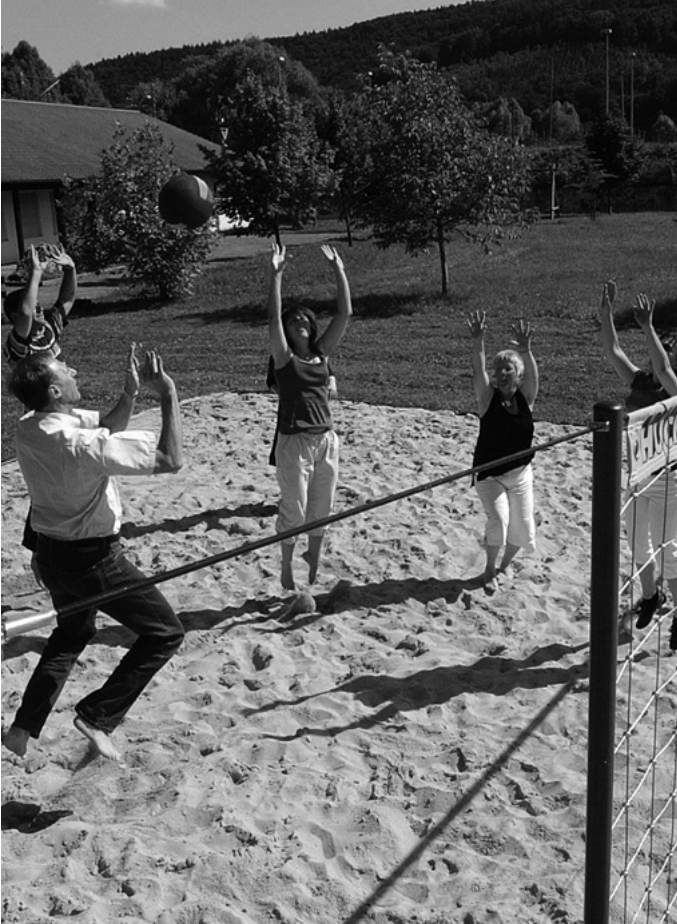
Das Beachvolleyballfeld beim Jugendhaus ist fertig gestellt. Es wird im Rahmen eines kleinen Turniers eingeweiht.