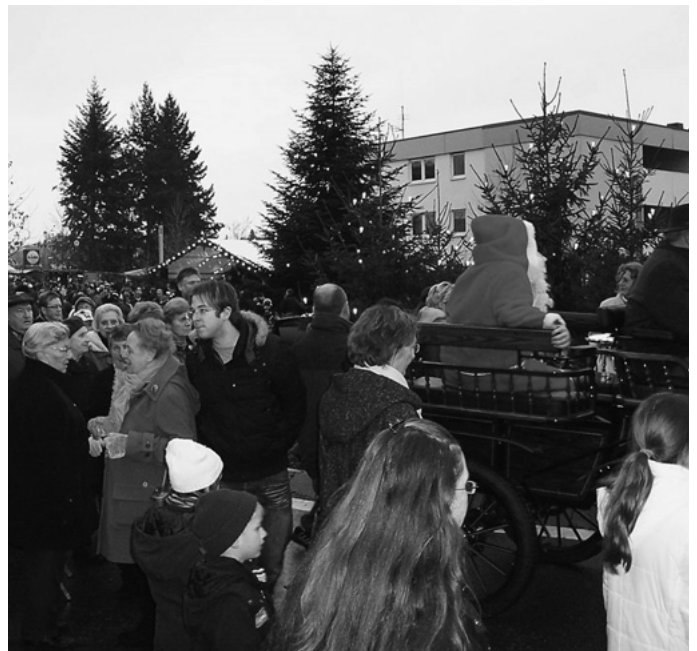
Erstmals an seinem neuen Standort in der Urbacher Mitte erfährt der 25. Weihnachtsmarkt einen nahezu doppelt so hohen Besucheransturm, wie in den vergangenen Jahren, und dies trotz des wenig einladenden Schmuddelwetters, das gerade um die Mittagszeit herum geherrscht hat.