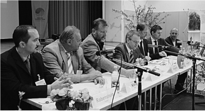
In Urbach findet eine landesweite Tagung zum Erhalt der Streuobstwiesen statt unter dem Motto: „Streuobst schafft regionale Identität: Kommunale Ansätze in Baden-Württemberg“.