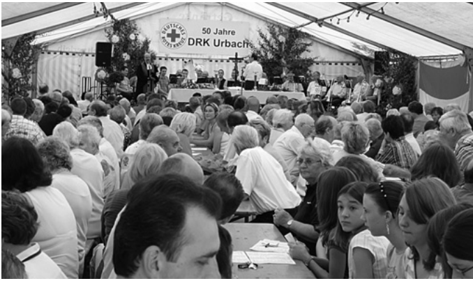
Der DRK-Ortsverein Urbach feiert zwei Tage lang seinen 50-jähriges Jubiläum mit einem Fest bei der Auerbachhalle.