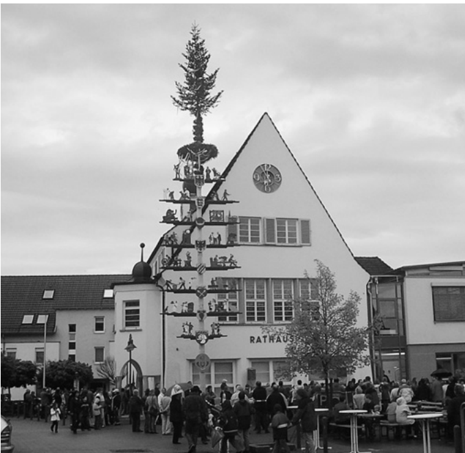
Nicht nur der „Tag des Baumes“ verregnet, leider auch die Maibaumfeier bleibt nicht von Regen verschont. Ein Novum in diesem Jahr, der Maibaum wird in etwas verkürzter Form beim Rathaus aufgestellt, da auf seinem angestammten Platz in der Grünlandstraße die Erschließungsarbeiten für die Urbacher Mitte stattfinden.