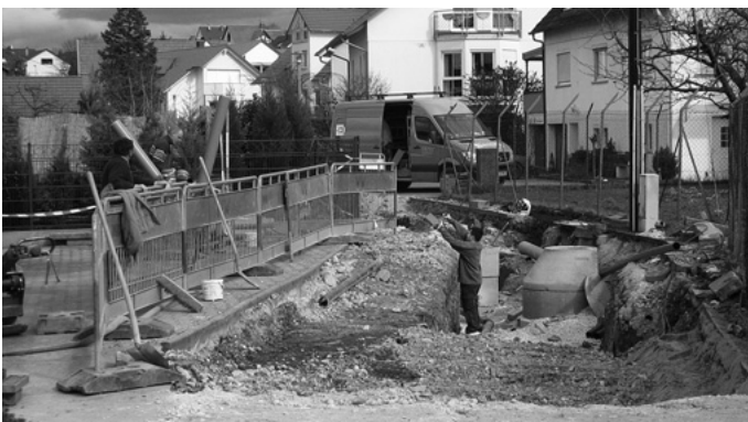
Nicht nur in der Urbacher Mitte, sondern auch in den Randgebieten, wie hier im Größenwiesenweg laufen die Leitungs-, Kanal- und Straßenbauarbeiten auf vollen Touren.