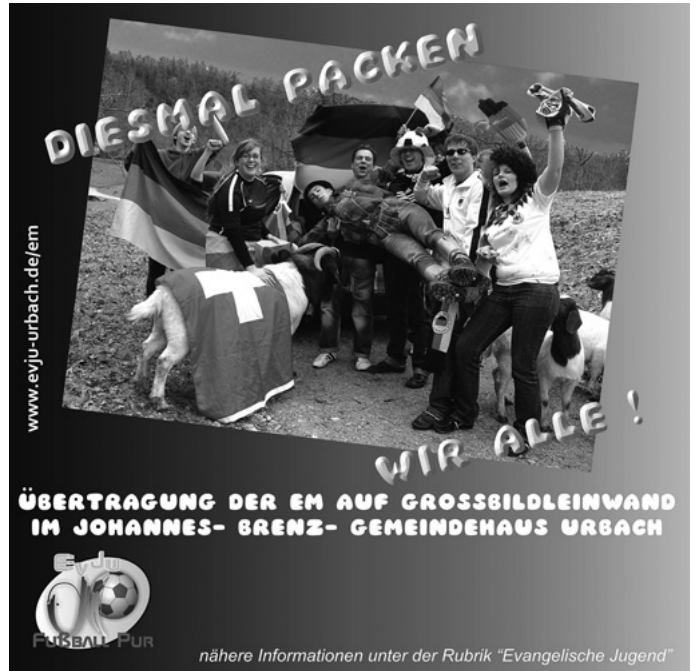
Die Fußball-EM sorgt auch in Urbach für große Euphorie. Die Evangelische Jugend sorgt dafür, dass das „Public Viewing“ auch in unserem Ort kein Fremdwort ist.