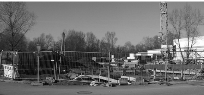
Das Regenklärbecken J an der Wasenstraße mit einem Fassungsvermögen von 835 m 3 ist im Bau. Die Kosten für diese Umwelt- bzw. Gewässerschutzmaßnahme belaufen sich auf rund 700.000,- €.