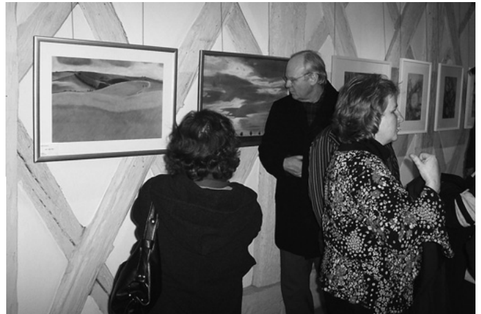
Nicht wenige Publikumszuspruch erfährt die Jahresausstellung der Urbacher Künstlergruppe „MalWe“ im Bürgerhaus „Museum am Widumhof“. Sie bietet dem Besucher die ganze Bandbreite (freizeit) künstlerischen Schaffens in Urbach.