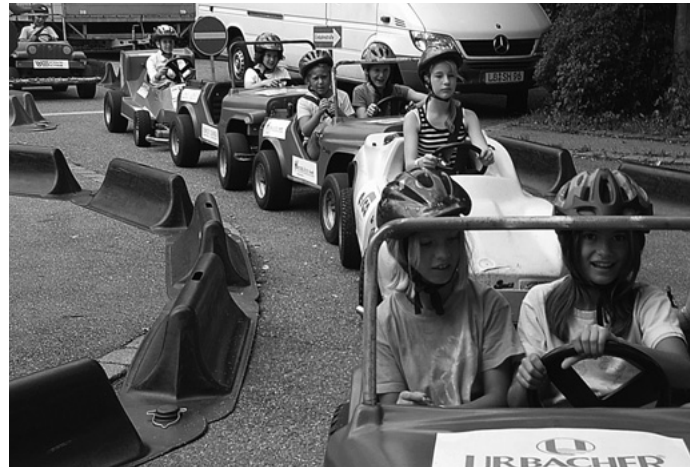
Auch in den Ferien ist in Urbach für Kinder und Daheimgebliebene einiges geboten. Das Ferienprogramm der Gemeinde und die Stadtranderholung sorgen dafür, dass keine Langeweile aufkommt – jedes Jahr ein großer Renner sind die „Minicars“.