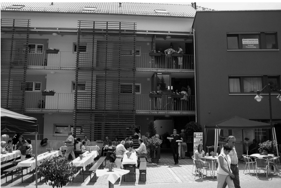
Ein das Ortsbild vom nördlichen Ortskern prägender Neubau wird offiziell eingeweiht. Das „Haus an der Hauptwach“, wie das vom Dossenheimer Spezialisten für Seniorenwohnanlagen FWD gebaute Domizil für Ältere benannt wird, beherbergt insgesamt 20 behindertengerechte Wohnungen, Gemeinschaftsräume sowie die Urbacher Geschäftsstelle des Diakoniewerks „Bethel“.