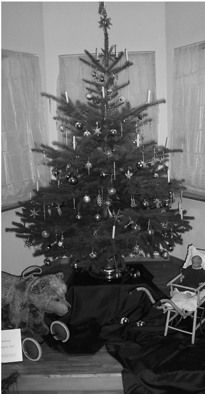
Als wahrer Besuchermagnet – nicht nur beim Weihnachtsmarkt – erweist sich die Christbaumausstellung im Rathaus. Fünf Tage lang gibt es ein Rahmenprogramm zu der Ausstellung von sehr unterschiedlich geschmückten Weihnachtsbäumen.