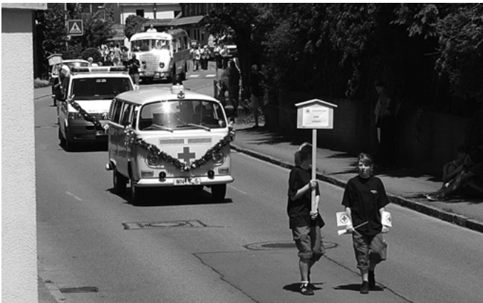
Anlässlich des DRK-Jubiläums findet wieder einmal ein großer Festumzug in Urbach statt. Der Tross historischer Gefährte, Festwagen, Fußgruppen und Musikkapellen führt von der Espachhalle durch den ganzen Ort bis zur Auerbachhalle.