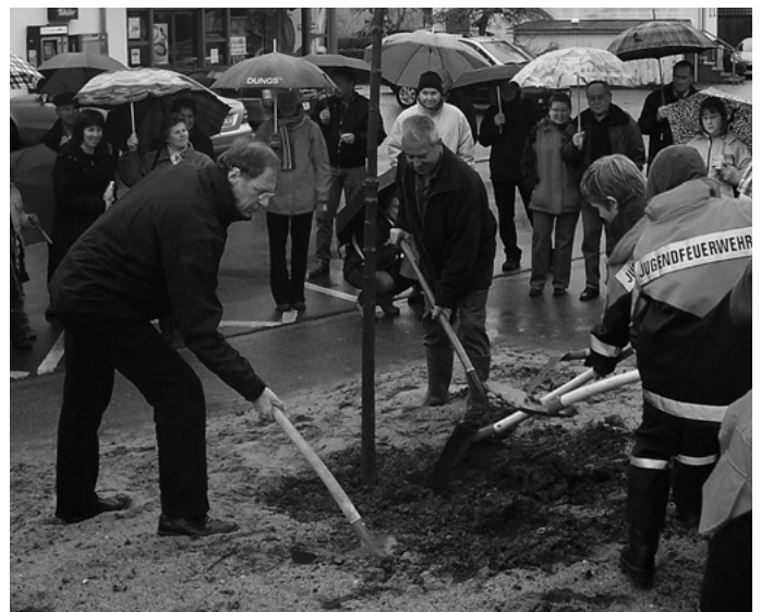
Nach langer Zeit einmal wieder regnerisches Wetter gibt es beim „Tag des Baumes“. Ein Glück, dass man als Standort für die zu pflanzende „Manna-Esche“ das Feuerwehrhaus ausgesucht hat. Dort gibt es Platz zum Unterstehen.