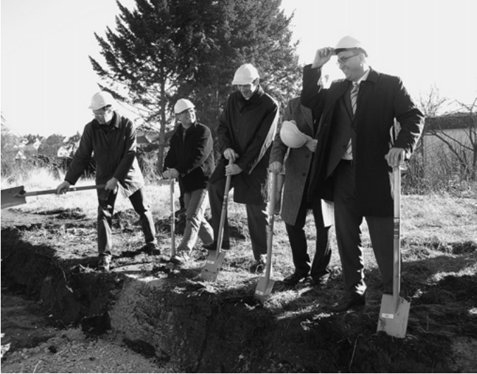
Der 1. Spatenstich zum Bau der Lebensmittelmärkte in der Urbacher Mitte fällt. In nur acht Monaten entstehen der REWE und Lidl-Einkaufsmarkt samt Papeterie Donner und Café Eins sowie der neue Marktplatz.