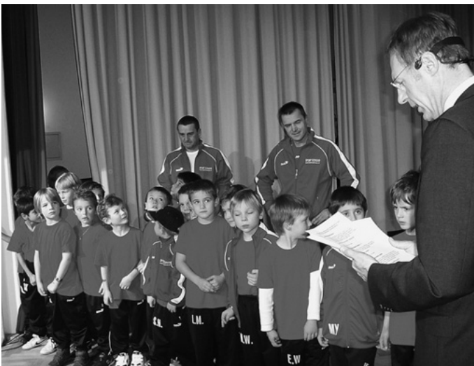
Bei der Sportlerehrung der Gemeinde ist in diesem Jahr ein Rekord zu vermelden. 176 Kinder und 147 Erwachsene konnten in der abgelaufenen Saison sportliche Erfolge erzielen. Damit werden bei der Sportlerehrung so viele Athletinnen und Athleten ausgezeichnet wie noch nie.