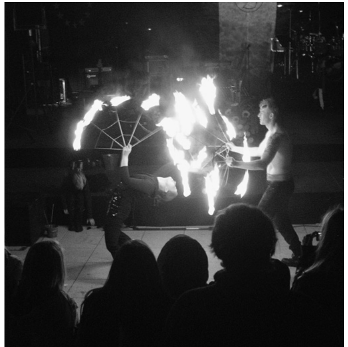
... und einer stimmungsvollen Feuershow.