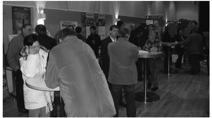
In der Auerbachhalle präsentieren Urbacher Firmen und Handwerksbetriebe Möglichkeiten zum Energie sparenden Bauen und Modernisieren.