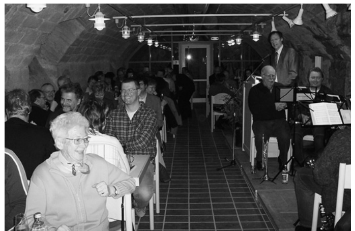
Ganz früh im Monat wegen Ostern treffen sich die Freunde und Kenner des vergorenen Apfelsafts zum 24. Mostseminar. Ein Novum in diesem Jahr – der Siegermost vom vergangenen Jahr eringt als 2-Jähriger erneut den Titel bei der Prämierung.