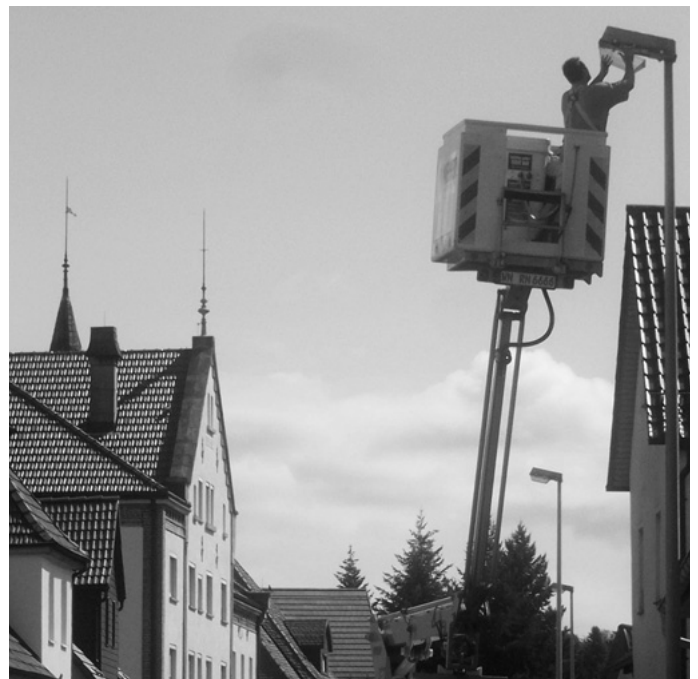
Es wird damit begonnen, die Straßenbeleuchtung von Urbach aus Kosten- und Klimaschutzgründen auf Energiesparlampen umzurüsten. Künftig leuchtet der größte Teil der Urbacher Straßenlampen in einem warmen Gelblicht.