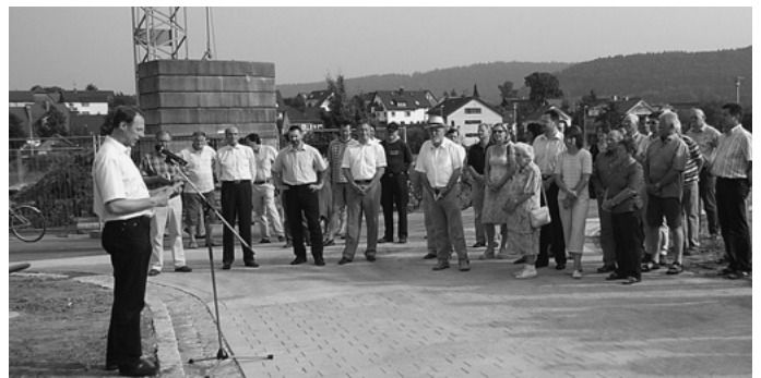
Die Erschließung des Wohnteils in der Urbacher Mitte wird fertig gestellt und im Rahmen einer kleinen Feier offiziell eingeweiht.