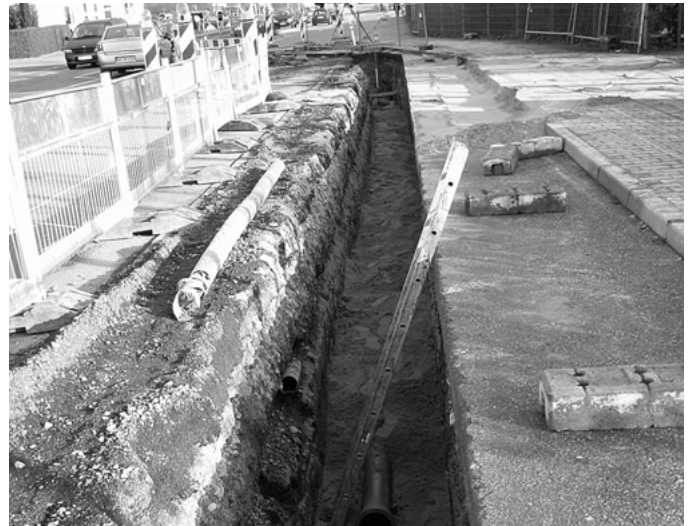
In der Wasenstraße wird die Wasserversorgung der Gemeinde optimiert. Die Fa. Hortus und der Wassermeister der Gemeinde, Ernst Benzenhöfer, arbeiten unter schwierigen Bedingungen nachts und am Wochenende Hand in Hand, um die Behinderungen so gering wie möglich zu halten.