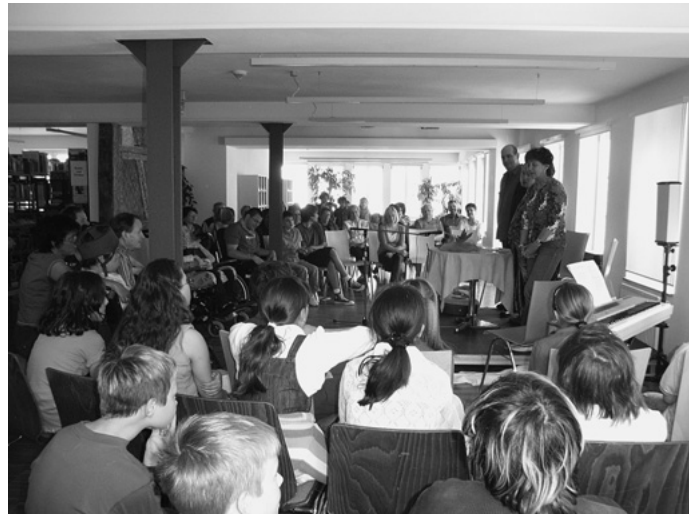
„Mittendrin statt außen vor“ – so heißt eine Aktion des Landes Baden-Württemberg für Menschen mit Behinderung. Die Gemeinde lädt in diesem Kontext ein zu einer „Begegnung der besonderen Art“ in der Urbacher Mediathek.