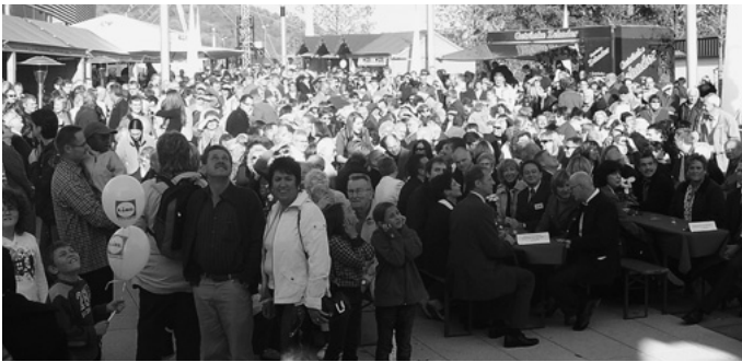
Die Urbacher feiern ihre neue Mitte mit einem zweitägigen Fest....