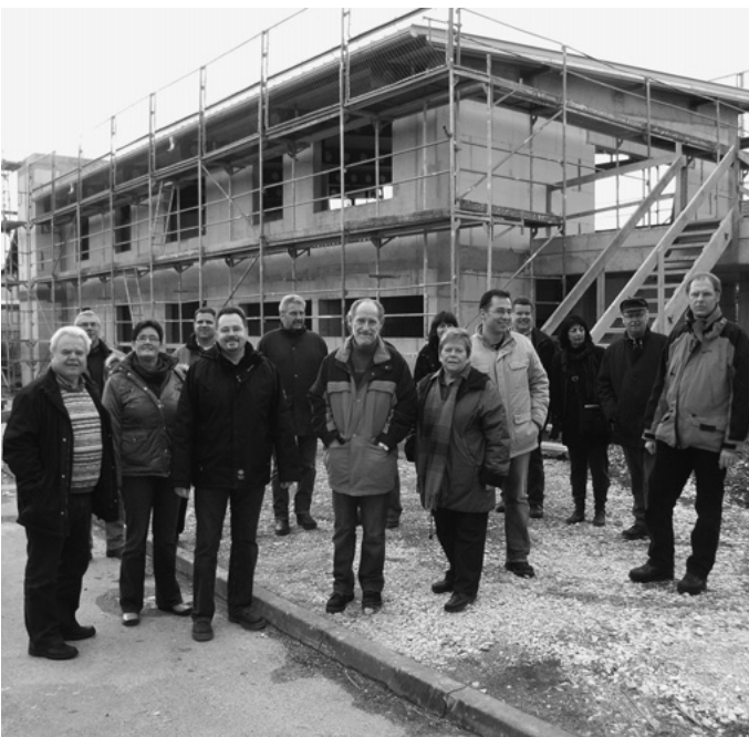
„Zwischen den Jahren“ unternehmen die Gemeinderäte und die Verwaltung stets ihren Inventurrundgang. Hier besichtigen sie den Anbau der Wittumschule, damals noch im Rohbau.