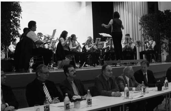
In der Auerbachhalle findet die im zweijährigen Turnus wiederkehrende Bürgerversammlung statt. Verwaltung und Gemeinderat informieren die Bürgerschaft über alle wichtigen kommunalpolitischen Themen und Projekte. Hier der Musikverein bei der Eröffnung.