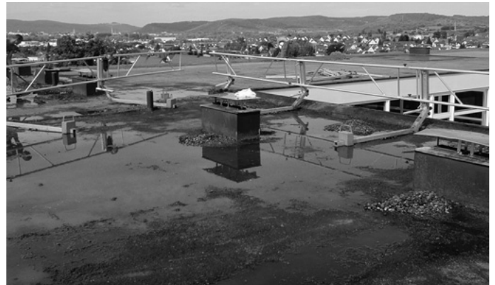
Das Dach der Atriumschule wird saniert. Im Laufe der nächsten Monate wird dort auch eine weitere gemeinschaftliche Photovoltaikanlage errichtet. Außerdem erhält die Atriumschule in den Ferien eine neue energiesparende Heizungsanlage mit einem Blockheizkraftwerk.