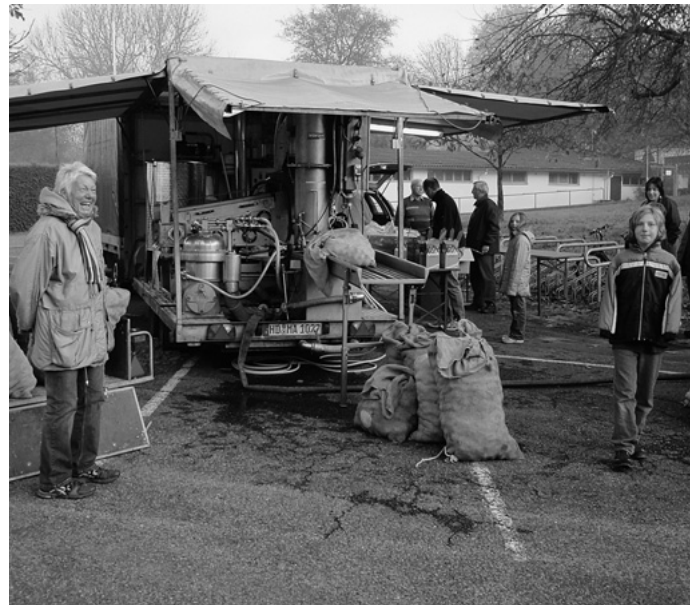
Auch in diesem Jahr wieder ein voller Erfolg, die Saftpressaktion beim Freibad, bei der Stücklesbesitzer ihr Mostobst sofort kelternd und abfüllen lassen können.