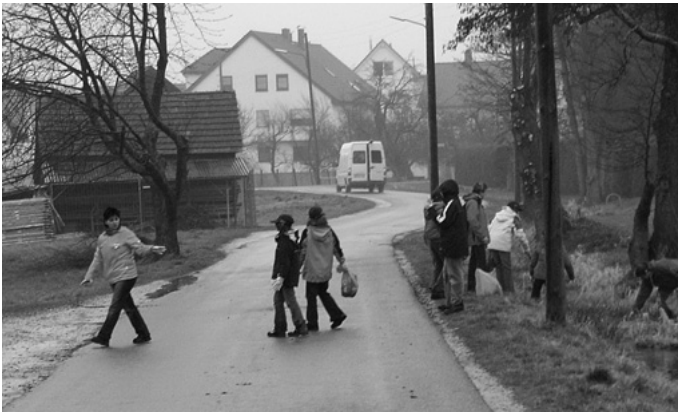
Bei der Kreisputzte erfährt auch die Urbacher Gemarkung eine gründliche Säuberung. Mehr als 470 überwiegend jugendliche Putzerinnen und Putzer beteiligen sich bei nasskaltem Wetter an der Aktion für ein sauberes Ortsbild unserer Gemeinde.