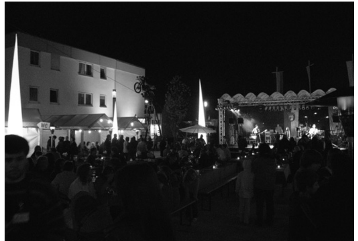
... Live-Musik und Lichtperformance am Abend