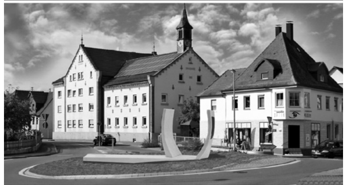
Ein Kunstwerk für den Kreisverkehrsplatz in der Urbacher Mitte – das will die Mehrheit der Urbacher Bürgerschaft nicht. In einem Bürgerentscheid sprechen sich 37,8% aller Wahlberechtigten dafür aus, einen bereits vom Gemeinderat gefassten Beschluss wieder aufzuheben, ein Kunstwerk des renommierten Bildhauers Josef Nadj zu kaufen.