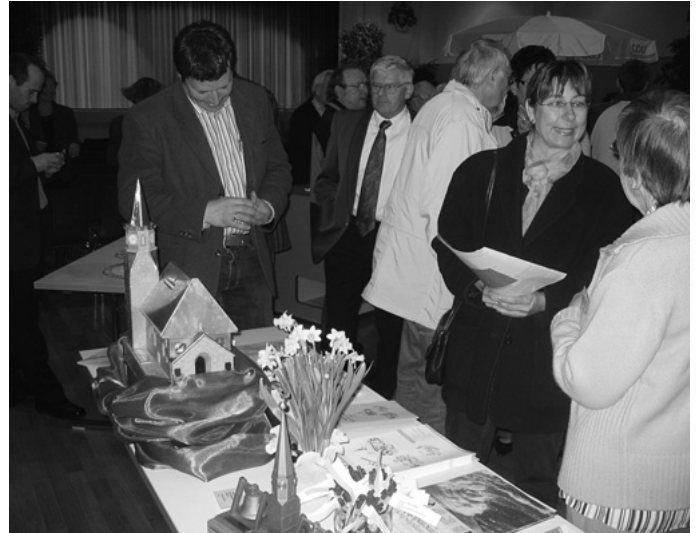
Die Gemeinde lädt die Zugezogenen zu einem Neubürger-Treff in die Auerbachhalle ein. Dort präsentieren Vereine, Kirchen und Gemeindeverwaltung ihre Angebote