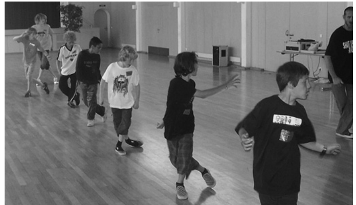
„Boys only“- einen Tag nur für Jungs veranstaltet das Jugendhaus UYC. Workshops über die Kunst des Billard-Spielens, die Funktionsweise von Solarzellen, cooles Tanzen oder das Gestalten von Schmuck und vieles mehr stehen auf dem Programm.