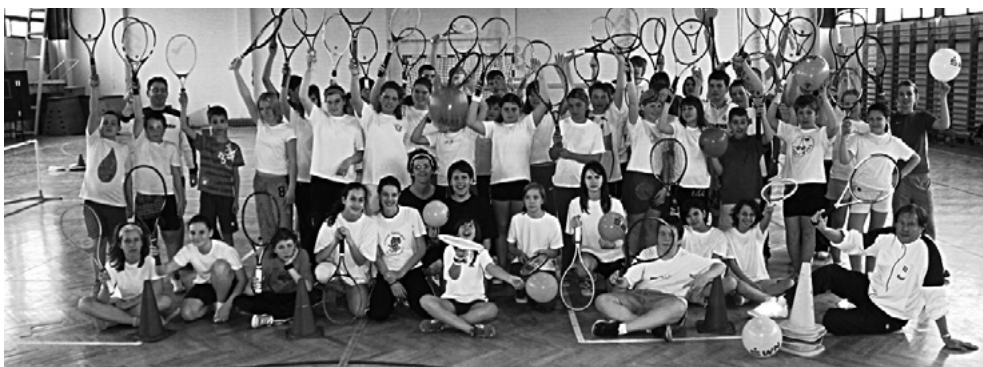
Der TC Urbach veranstaltet in den Osterferien ein Tennis-Camp in Urbachs Partnerstadt Szentlőrinc, das überwältigenden Zuspruch findet.