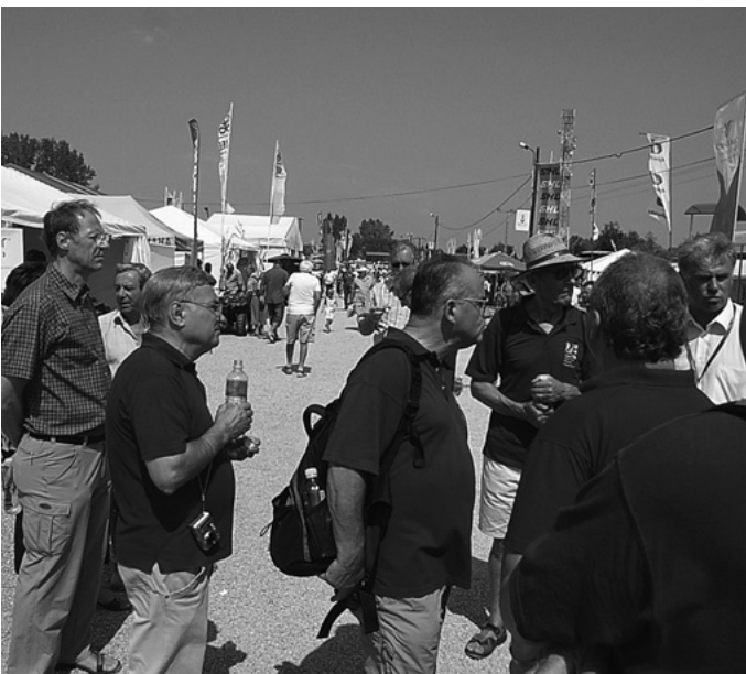
Eine Delegation aus Urbach nimmt an den Farmerstagen in Szentlőrinc teil, einer großen landwirtschaftlichen Ausstellung, die jährlich in Urbachs Partnerstadt stattfindet.