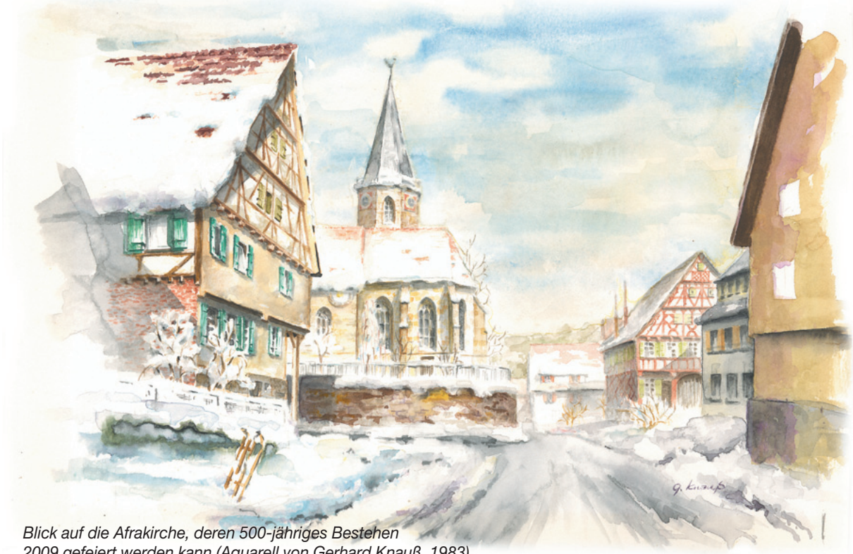
Blick auf die Afrakirche, deren 500-jähriges Bestehen 2009 gefeiert werden kann (Aquarell von Gerhard Knaub, 1983)