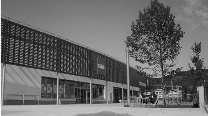
Ein Jahrhundertereignis für Urbach ist die Einweihung der neuen Urbacher Mitte. Damit wird ein neues Zentrum geschaffen und die Zusammenführung der beiden ehemaligen Ortsteile endgültig vollzogen.