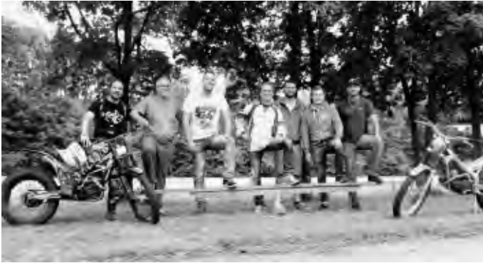
Gruppenfoto beim Geschicklichkeitsfahren