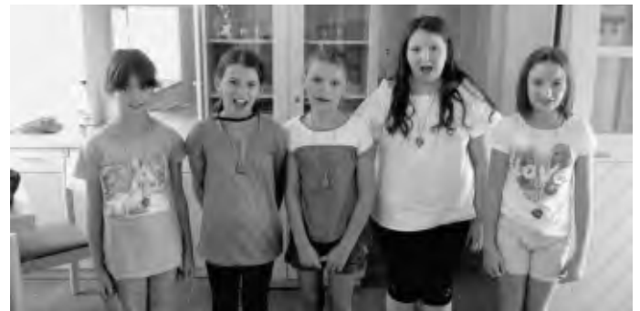
ganz tolle Arbeiten sind entstanden