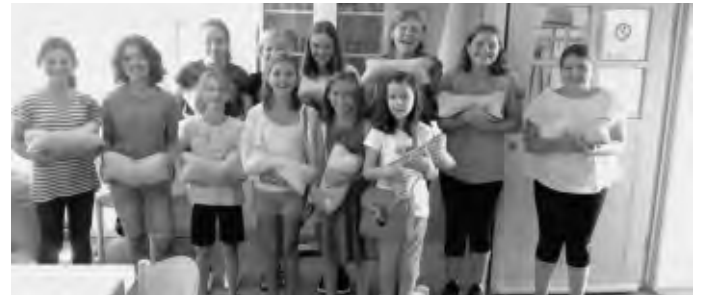
Leseknochen - auch zum Schlafen geeignet