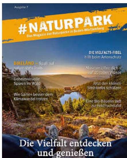
Das jährlich erscheinende Magazin #Naturpark beleuchtet nachhaltige Regionalentwicklung und kulturelles Erbe.