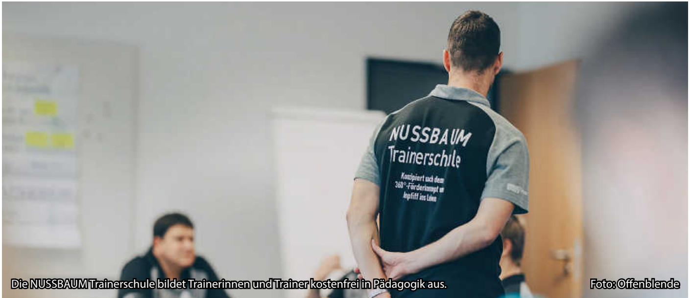
Die NUSSBAUM Trainerschule bildet Trainerinnen und Trainer kostenfrei in Pädagogik aus.