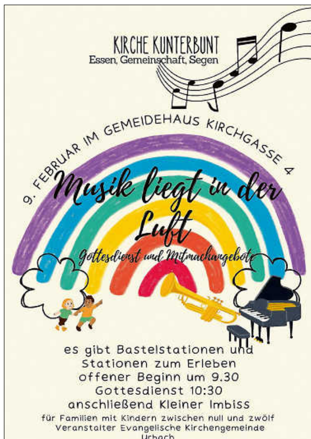
Kirche Kunterbunt 9. Februar

Glaube ist der Vogel, der singt, wenn die Nacht noch dunkel ist. Im Gemeinsamen Singen die Hoffnung sichtbar und hörbar werden lassen, das ist die Idee der neuen gemeinsamen Aktion der Urbacher Kirchen: Singen im Dunkeln. Wir möchten gemeinsam ein Lichtzeichen setzen in einer dunklen Welt. Dazu müssen Sie nicht singen können: einfach dabei sein und warm eingemummelt eine Kerze halten. Das kann jede und jeder. Ein kurzer Impuls, gemeinsame Lieder, ein Heißgetränk, gute Gespräche, sind Sie dabei? Bitte die eigene Tasse mitbringen, Kerzen mit Tropfschutz werden gestellt. Dienstags um 19 Uhr.