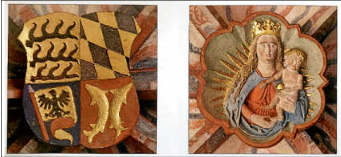
Links: Schlussstein mit Wappen des Herzogtums Württemberg; Rechts: Schlussstein mit Madonnendarstellung

kes der Kirchengemeinde an die Unterstützer des Kirchenbaus erinnern. Worin die Unterstützung im Einzelnen bestand, ist leider nicht überliefert. Sollte die Hypothese dennoch zutreffen, stellt sich die Frage, um welche vier „Sponsoren“ es sich denn handelt.