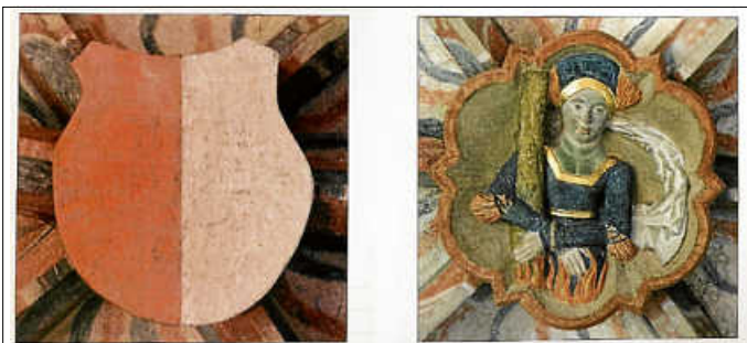
Links: Schlussstein mit Wappen der Herren von Urbach; Rechts: Schlussstein mit Darstellung der heiligen Afra

Der zweite Schlussstein zeigt das Brustbild einer goldgekrönten, blau und rot gekleideten Madonna als Himmelskönigin vor einem Strahlenkranz mit dem Kind auf dem linken Arm. Im Schoß des Kindes liegt eine goldene Kugel, ursprünglich als Apfel ein Attribut Marias als „die neue Eva“ später dann umgedeutet als Weltkugel und damit Zeichen der zukünftigen Wirkmächtigkeit des Gottessohnes. Dieses Motiv ist eine nahezu perfekte Kopie der Madonnendarstellung, die im oberen Teil des Wappens des Klosters Elchingen dargestellt ist, womit auch klar ist, wem hier als zweitem Sponsor der Dank der Kirchengemeinde galt. Die Afrakirche gehörte seit seiner Gründung im Jahr 1115 dem Kloster Elchingen. Zur Zeit der Erbauung der Kirche war das Kloster immer noch Patronatskirche. Dies änderte sich erst 1536, als die Afrakirche an das Haus Württemberg verkauft wurde und in Urbach die Reformation stattfand.