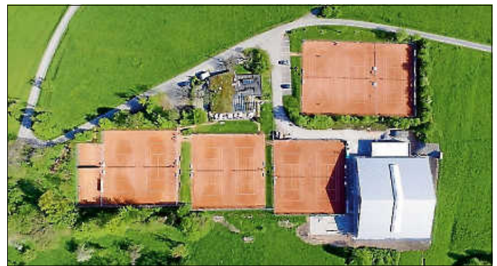
Komm zu uns – unsere wunderschöne Anlage begeistert