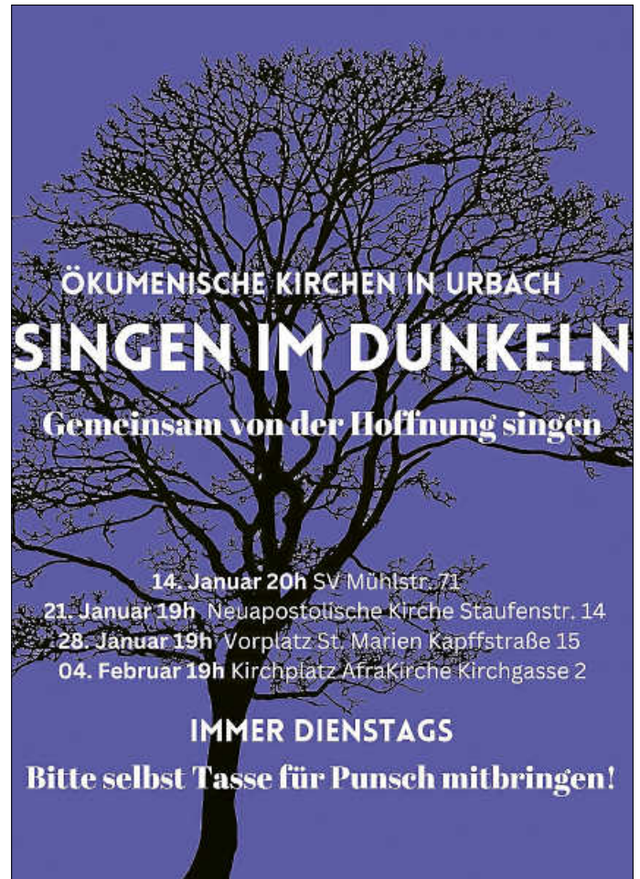
Singen im Dunkeln

Dienstag, 4. Februar, Kirchplatz Afrakirche Kirchgasse 2, 19 Uhr