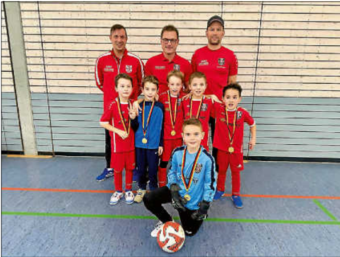
F2-Turnier in Weiler