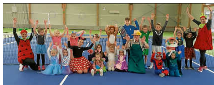
Immer was los beim TCU