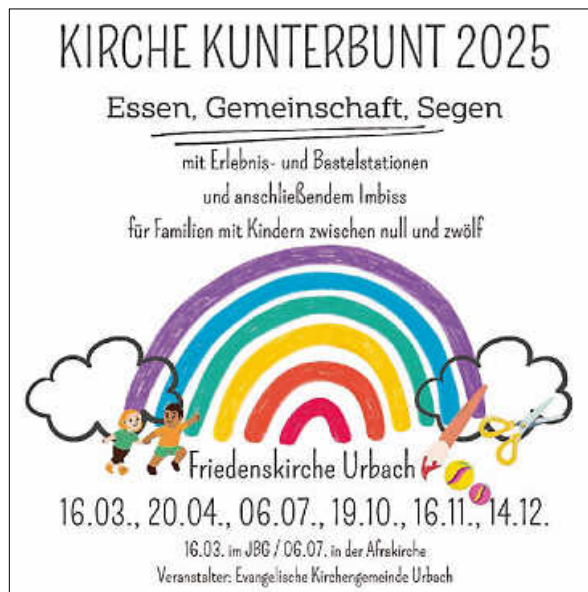
Jahresprogramm Kirche Kunterbunt

Möchten auch Sie ein Ihnen unbekanntes Lied gesungen haben, oder vermissen Sie schon länger eines Ihrer Lieblingslieder im Gottesdienst? Schreiben Sie uns gerne Ihren Liedwunsch aus NL+ (Wo wir dich loben Plus) oder EG (Evangelisches Gesangsbuch) auf die im Gottesdienst ausliegenden Postkarten und werfen Sie diese in die bereitstehende Box. Wir freuen uns auf Ihre Vorschläge und das gemeinsame Singen in unseren Gottesdiensten, denn: „Singen macht Spaß, Singen tut gut, ja Singen macht munter und Singen macht Mut! Singen macht froh und Singen hat Charme, die Töne nehmen uns in den Arm.“ (Liedtext: Uli Führe)