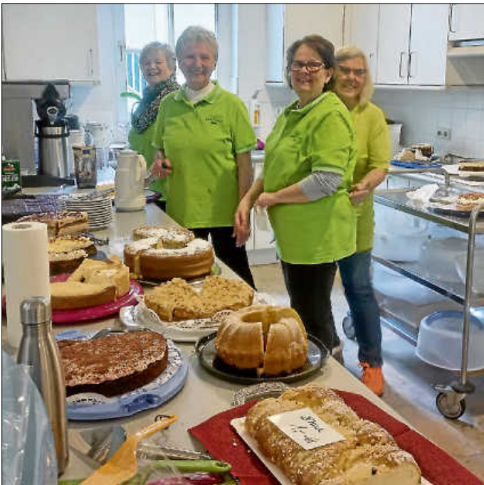
Danke an das Helferteam!

Viele Besucher, zeitweise war voll besetzt, ließen sich unseren selbstgebackenen Kuchen und Torten bei netten Gesprächen schmecken.