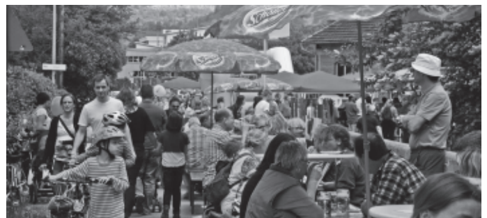
Urbach zeigt sich bei „RemsTotal“, einer gemeinschaftlichen Veranstaltung aller Rems-Anliegergemeinden, von seiner schönsten Seite. Beim 3. Urbacher Kulinarium, der Brückenhocketse, beim Kanufahren an der Rems, der Besichtigung des Wasserkraftwerks am Remswehr und Hölderlin-Rezitationen auf dem Gänsberg werden sowohl die kulinarischen, als auch die landschaftlichen Reize von Urbach präsentiert.