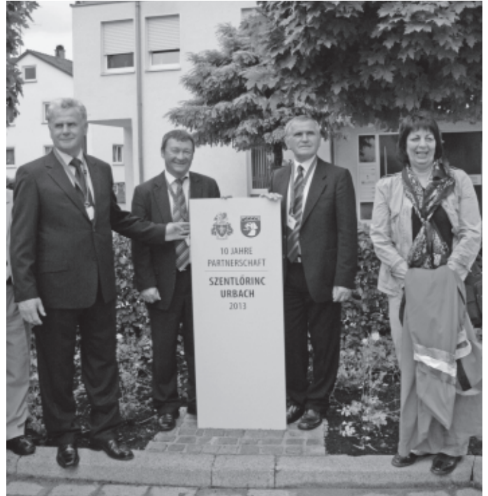
Sonntagmorgens wird nach dem Gottesdienst in der Afrakriche vor dem Rathaus eine Partnerschaftsstele enthüllt.