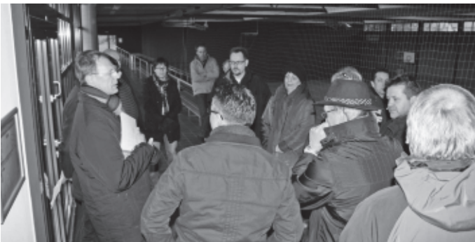
Wie jedes Jahr unternimmt der Gemeinderat „zwischen den Jahren“ seinen Inventurrundgang. Auf dem Programm stehen Projekte, die angegangen werden müssen, wie hier die Sanierung der Wittumhalle.