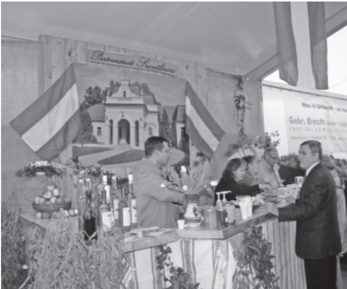
Auch bei der Leistungsschau ist eine Delegation aus Szentlőrinc mit eigenem Stand dabei.