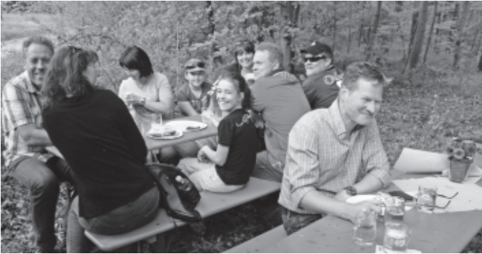
Beim 3. Urbacher Kulinarium nehmen in diesem Jahr 220 Wanderer die Gelegenheit wahr, gutes Essen, eine prachtvolle Frühlingslandschaft und Bewegung in freier Natur miteinander zu verbinden.