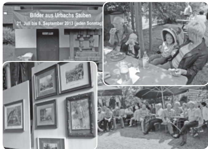
Der Geschichtsverein feiert seine „Farrenstall-Hocketse“ und zeigt begleitend die Ausstellung „Bilder aus Urbachs Stuben“.

Ausflüge wie hier in die Mercedes-Benz-Arena, der Heimat des VfB Stuttgart, sind ebenso im Angebot,