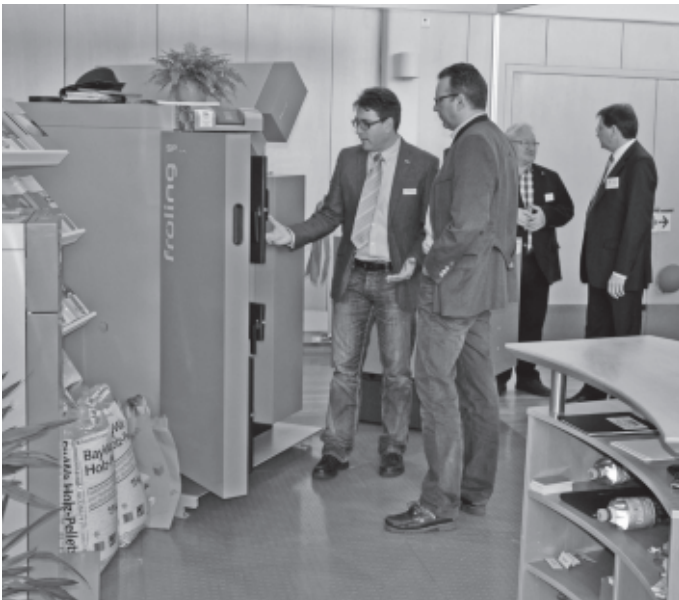
Einer der Höhepunkte im diesjährigen Veranstaltungskalender ist die Messe Urbach. An drei Tagen zeigt der örtliche Handel, Mittelstand, das Handwerk und Dienstleister ein breites Spektrum ihrer Tätigkeit.