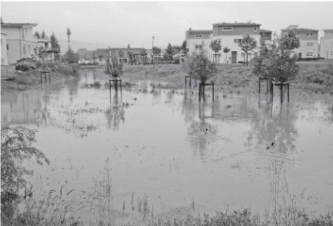
Der Mai macht zum Monatsende seinem Ruf als Wonnemonat keine Ehre. Sintflutartige Regenfälle lösen Hochwasseralarm bei Feuerwehr und Gemeinde aus. Erstmals wird auch die Mulde in der Urbacher Mitte durch den Urbach geflutet. Enten bevölkern schnell den neuen Teich. Glücklicherweise hört es aber rechtzeitig zu regnen auf, bevor entlang von Bärenbach, Urbach und Rems größere Schäden entstehen können.