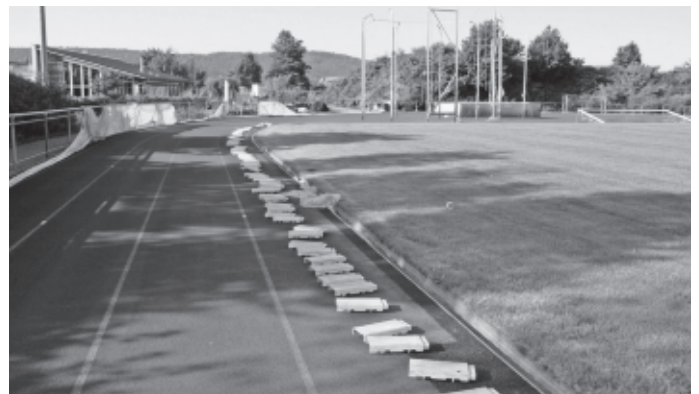
Die Tartanbahn im Wittumstadion wird im Sommer grundlegend saniert und die Linierung erneuert. Nach nahezu 15 Jahre war diese rund 45.000,-- € teure Maßnahme erforderlich, um auch den Leichtathleten wieder optimale Trainings- und Wettkampfmöglichkeiten zu ermöglichen