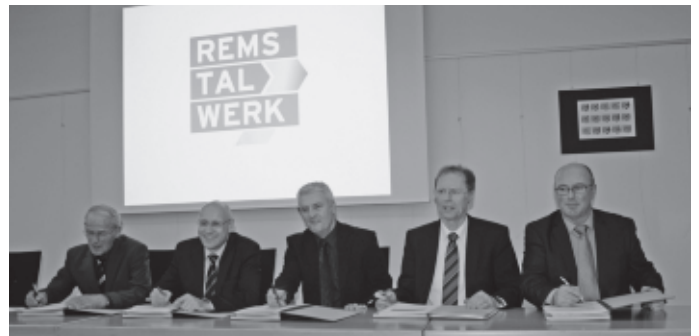
Die Bürgermeister der Gemeinden Kernen, Remshalden, Winterbach und Urbach unterzeichnen den Stromkonzessionsvertrag mit dem von diesen Kommunen gegründeten Remstalwerk. Für diese Gemeinden ist dies ein Meilenstein auf dem Weg zu einer regional geprägten und bürgernahen Energieversorgung.