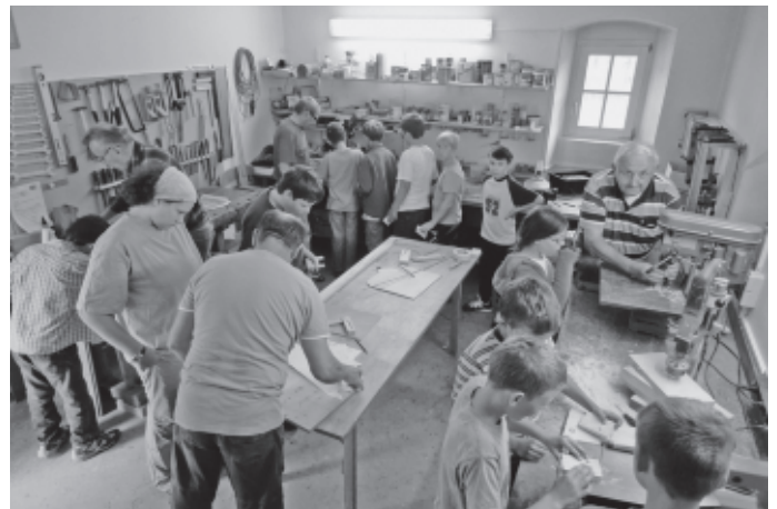
wie Aktivangebote zum Mitmachen, z.B. in der Holzwerkstatt der Senioren im Schloss.