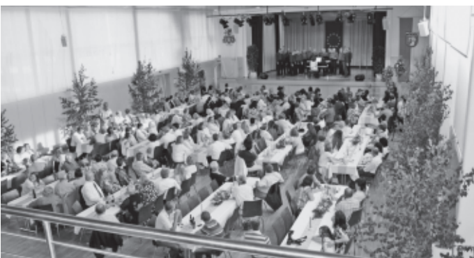
10 Jahre Partnerschaft mit unserer ungarischen Partnerstadt Szentlőrinc wird gleich zu Beginn des Monats über ein volles Wochenende gefeiert. Los geht es mit einem Partnerschaftsabend in der Auerbachhalle.