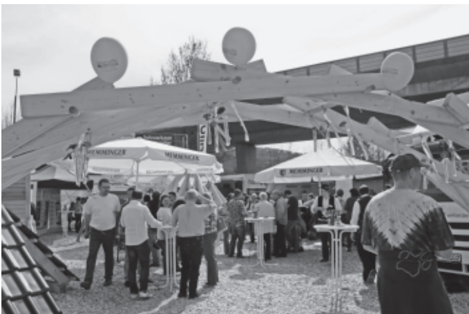
Sowohl die Stände in der Auerbachhalle, als auch in den Zelten und im Außenbereich rund um die Halle werden über alle Tage hinweg gut besucht.