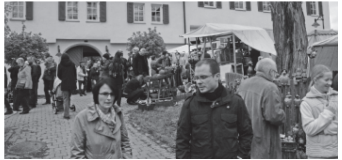
Ein weiterer alljährlicher Höhepunkt im Veranstaltungsjahr ist der Remstaler Töpfermarkt, der in diesem Jahr zum 23. Mal rund um das Schloss Urbach stattfindet.

90 Aussteller aus ganz Deutschland und weiteren vier europäischen Ländern machen Urbach für zwei Tage zum Mekka für Freunde der Töpferkunst und Keramik aller Art.