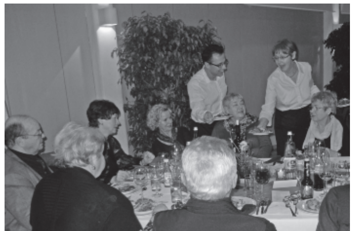
Die Bürgerstiftung „Kind und Jugend“ veranstaltet in der Auerbachhalle ihr zweites Stiftungsmenü. Ein gutes Essen mit edlen Getränken, anregende Gespräche und das alles für einen guten Zweck – Herz was willst Du mehr!