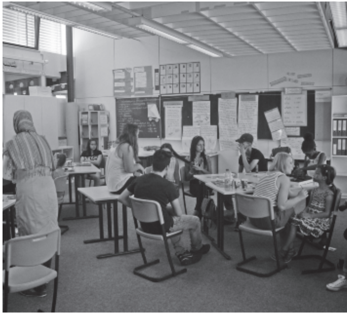
Die Wittumsschule feiert ihr Schulfest mit zahlreichen Mitmachangeboten und viel Information zum Motto „Eine Reise durch die Zeit“.