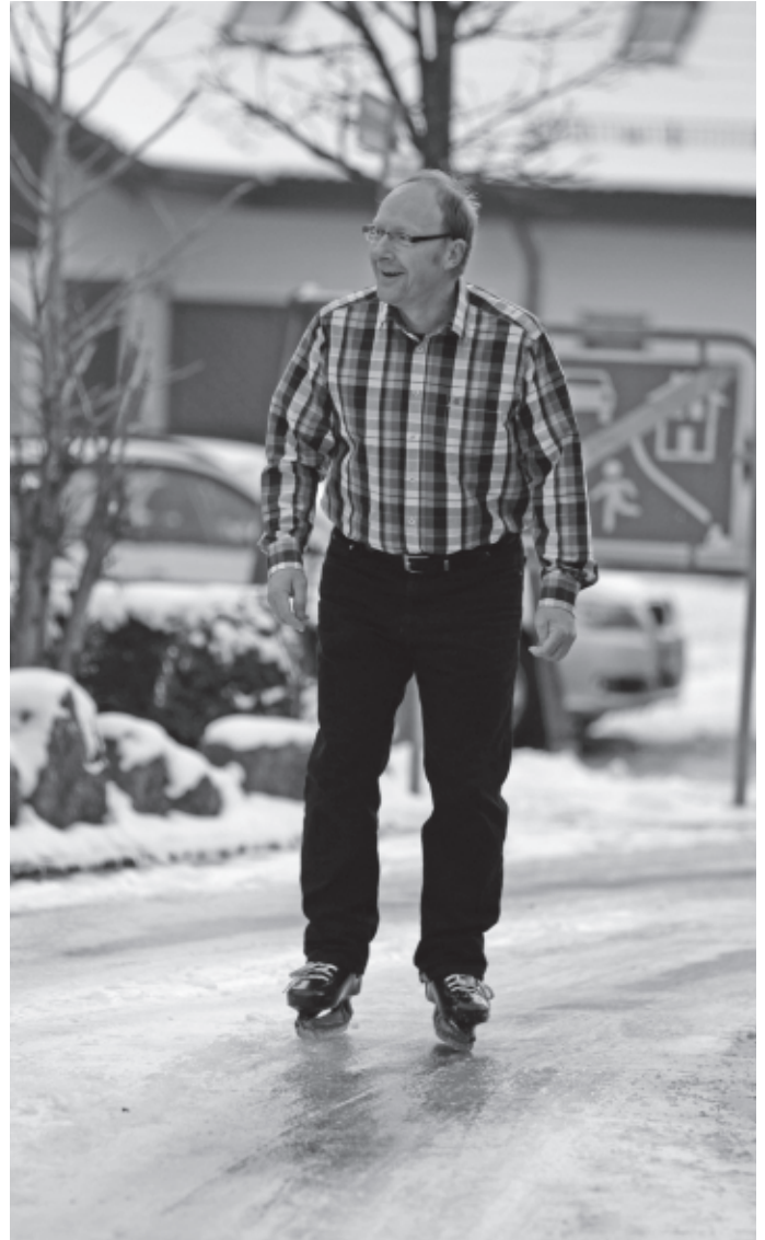
Am Sonntagmorgen 20. Januar legt Blitzeis den Verkehr in Urbach lahm. Es ist so glatt auf den Straßen, dass zunächst nicht einmal die Räumfahrzeuge ausrücken können. Auf den vereisten Straßen kann man Schlittschuh laufen.