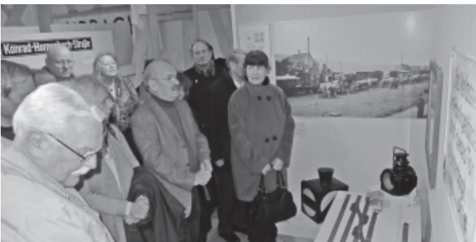
Im „Museum am Widumhof“ wird eine neue Ausstellung des Urbacher Geschichtsvereins eröffnet. Die Schau über den Bahnhof mit dem Titel „Haltepunkt Urbach bei Schorndorf“ interessiert nicht nur Eisenbahnfreunde