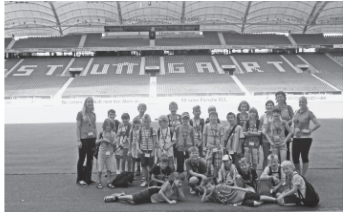
Das Ferienprogramm der Gemeinde sowie die Ferienbetreuung in der Atriumhalle sind bereits seit langem ein attraktives Angebot für Kinder, die in den Ferien daheim sind.

Ausflüge wie hier in die Mercedes-Benz-Arena, der Heimat des VfB Stuttgart, sind ebenso im Angebot,