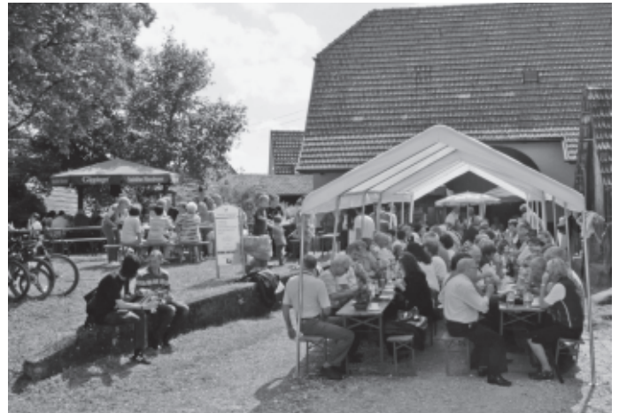
Nachmittags wird am Museum „Farrenstall“ bei schönstem Wetter eine Partnerschaftshocketse gefeiert.