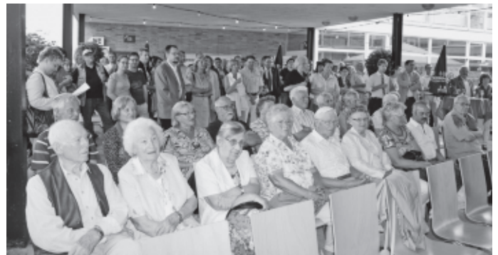
In der Atriumschule feiert die Gemeinde dieses Jahr wieder einen Sommerempfang. Neben einem Ausblick auf das kommunale Geschehen in Urbach erleben die Gäste an einem schönen Frühsommerabend Ehrungen verdienter Bürgerinnen und Bürger und erstmals auch die Ehrung musikalischer Talente. Im Anschluss an den offiziellen Teil klingt der Abend bei zwanglosen Gesprächen der Gäste aus allen Gesellschaftsschichten der Urbacher Bürgerschaft und den Nachbarkommunen aus.