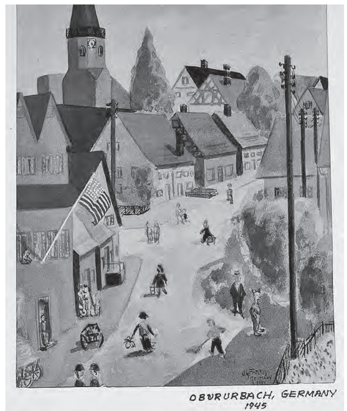
OBERURBACH, GERMANY 1945

„Ihr solltet sehen, wie die Leute hier drüben arbeiten. Sie stehen in aller Frühe am Morgen auf und sind bei der Arbeit bis 18.30 Uhr. Ich habe alte Männer und Frauen gesehen, die um die 75 Jahre alt waren und die mit einem Karren, der meist von zwei Kühen gezogen wird, hinaus aufs Feld und wieder zurückfahren müssen. Wenn sie von den Feldern zurückkommen, erwartet sie keine Erholung oder Filme wie bei uns. (...) Das Radio muss ihre einzige Art von Unterhaltung gewesen sein. Beinahe jeder in diesen kleinen ländlichen Gemeinden besitzt einen vierrädrigen Karren und ein Paar Kühe. Die ganze Arbeit, die sie zu tun haben, ist draußen auf den Feldern Gras zu schneiden und zu sammeln als Heu für ihre Tiere – oder Äste und Bäume als Feuerholz sammeln. (...) Sie haben nicht solche Sachen wie Öfen oder Heißwassererhitzer.“