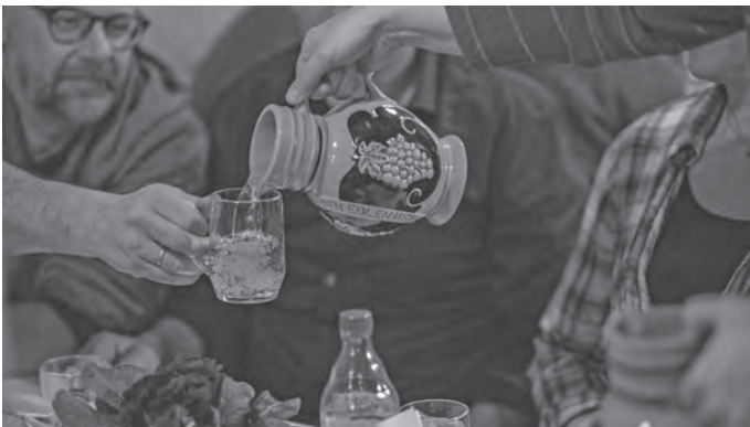
Der Most - das Urbacher Nationalgetränk - steht im Mittelpunkt des Abends

Der Vorverkostungstermin ist am Montag, 6. März um 19.00 Uhr im Schlosstreff.