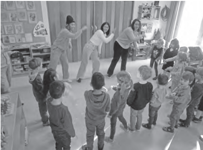
Besuch im Kindergarten

Im Anschluss lockerten wir uns alle mit einem rhythmischen, brasilianischen Tanz auf. Das gefiel den Kindern natürlich sehr und baute erstes Vertrauen und eine fröhliche, lockere Atmosphäre auf.