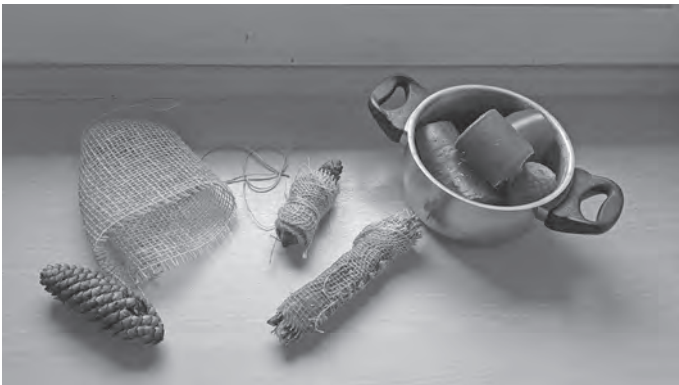
Kerzenreste - verwerten statt wegwerfen.

Die dunkle Zeit des Jahres ist nun bald vorüber. Im Februar werden die Tage nach Mariä Lichtmess (02.02.) langsam, aber doch wieder merklich länger. Die Weihnachts- und Jahreswechselzeit ist sehr geprägt vom Schein zahlreicher Kerzen. Und was ist jetzt davon übrig? Viele Kerzenreste. Damit diese nicht nur weggeworfen werden, gibt es heute ein paar Anregungen, diese Wachsreste zu recyceln.