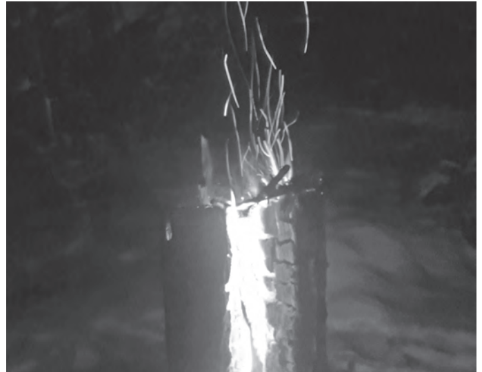
So brennt das Feuer ganz bestimmt!