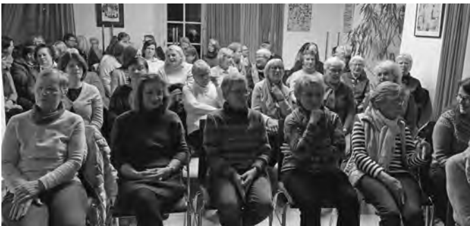
Die Begegnungsstätte platzte aus allen Nähten

Viele interessierte Gäste kamen in die Begegnungsstätte im Schloss Urbach. Wir mussten ständig Stühle hinstellen und am Ende waren es 50 Teilnehmer*innen.