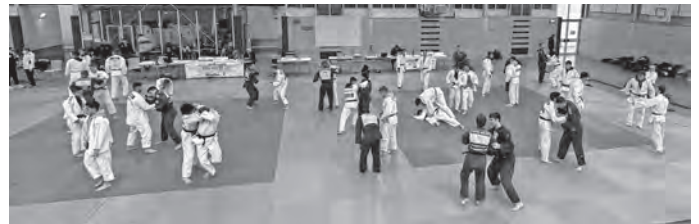
bei den SEM U21