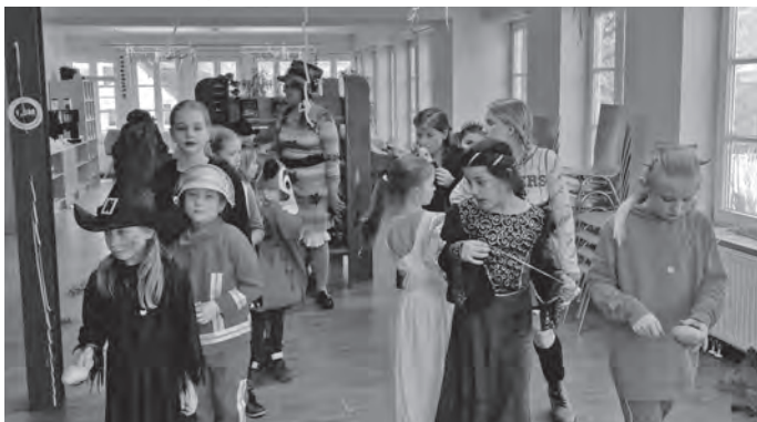
Kartoffellauf bei der Faschingsparty

Nach dem Schminken starteten wir in eine große Runde „Reise nach Jerusalem“, gefolgt von etlichen weiteren lustigen Partyspielen wie Luftballontanz, Stoptanz, einer Variante des altbekannten Plumpsackspiels, Kartoffellauf, Keks-wettessen und einem heiß umkämpften Tausziehen.