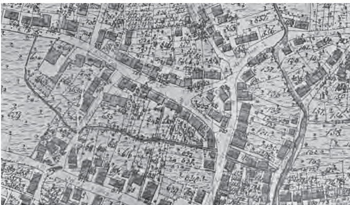
Ausschnitt aus der Urnummernkarte von 1831

Um den Webbach zu finden, hilft ein Blick auf die Urnummernkarte von 1831, denn dort ist er deutlich sichtbar eingezeichnet. Sein Ursprung liegt gemäß dieser Karte westlich des Schlosses am Rande der Schlossstraße, von wo aus er zunächst nach Süden, dann nach Südosten abbiegend am Schlossgarten vorbei zur Schrödergasse hin fließt. Von dort aus entspricht sein Verlauf exakt der heutigen „Webbach“ genannte Gasse. Nach Unterquerung der Haubersbronner Straße führt der Verlauf weiter durch die Gasse zwischen den heutigen Hausnummern 12 und 20 hin zur Uferstraße, wo der Webbach in den Urbach mündet.