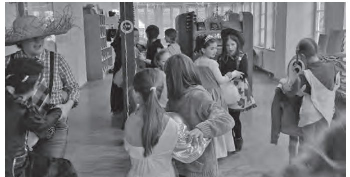
Volle Konzentration beim Luftballontanz

Viel Spaß hatten die Kinder auch mit dem großen farbigen Schwungtuch, unter dessen Stoffbahnen sich auf Zuruf immer wieder neu zusammengesetzte Kindergruppen zusammen fanden („alle Hexen und Zauberer“, „alle Tiere“, „alle Prinzessinnen...“). Zwischendurch gab es natürlich immer wieder Gelegenheit, sich mit Leckereien zu stärken und zu trinken. Fröhlicher Abschluss der Faschingsparty bildete die große Polonaise durch alle drei Etagen der Mediathek. Herzlichen Dank an alle teilnehmenden Kinder, unsere ehrenamtlichen Mitarbeiterinnen und Elke Peichl, es hat viel Spaß gemacht, mit Euch zu feiern!