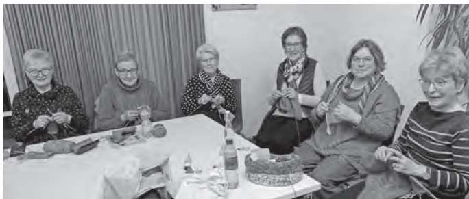
Es wurde fleißig gestrickt

Es wird viel gestrickt und gehäkelt beim Kreativtag, der jeden Montag in der Begegnung ab 19.30 Uhr stattfindet. Interessiert? Dann einfach vorbeischaun.