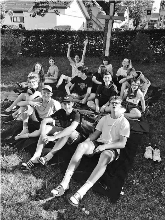
Endlich wieder Jugendkreis gemeinsam - allerdings nur bei schönem Wetter, auf der Wiese des Johannes-Brenz-Gemeindehauses

Ihr Team vom Förderverein evangelische Jugendarbeit Urbach