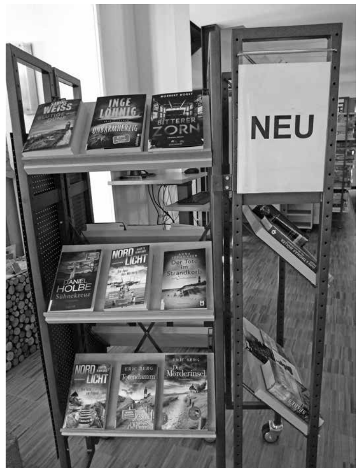
Spannende Krimis warten auf nervenstarke Leser*innen!