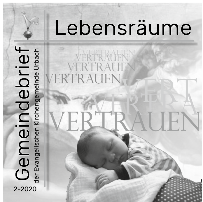
Gemeindebrief Lebensräume: Thema Vertrauen

Bitte haben Sie Verständnis für diese besonderen Maßnahmen.