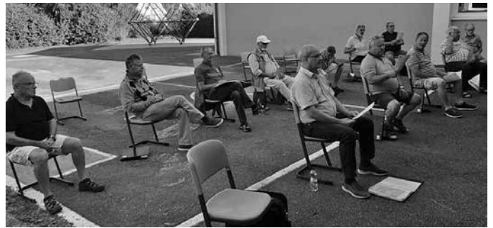
Der MännerChor - auf Distanz und doch zusammen

Vorstand und Mitglieder des MC Urbach Motorradclub e.V.