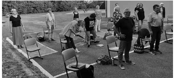
„ChorArt zwanzigelf“ - Gemeinsames Singen aber leider noch nicht in der Gesamtheit des Chores (hier: Bass- und Altstimmen)