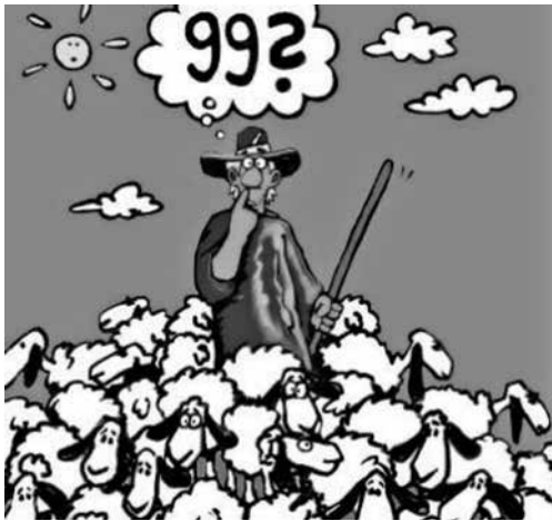
Kindermittmachgottesdienst rund um die Afrakirche

Vielen Dank schon jetzt für Ihren Einsatz.